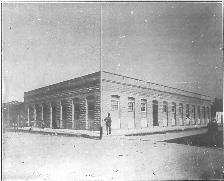
Casa escuela "Ricardo de la Torre", inaugurada el 5 del actual.

Los ejercicios que ejecutaron los pequeños alumnos, los brillantes discursos que se pronunciaron, los agasajos de que fueron objeto los Secretarios y sus acompañantes, el entusiasmo del pueblo y de sus Sociedades, entre las que el Casino Español descolló por su compenetración con el acto que se realizaba, dieron á Remedios la