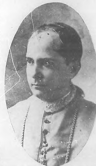
Monseñor Pedro Gonzalez Estrada, Obispo de la Habana.

A las 4 de la tarde del día 5 las campanas de la Catedral anunciaban que en ella se celebraba un acto solemne. Así era; y para presenciarlo habíanse reunido bajo la amplia nave del templo muchos fieles pertene-