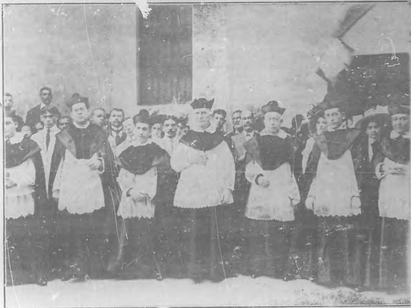
El nuevo Cabildo de la Catedral.

ciados con las canongías, con el ceremonial del caso, imponiéndoles el birrete y las vestiduras.