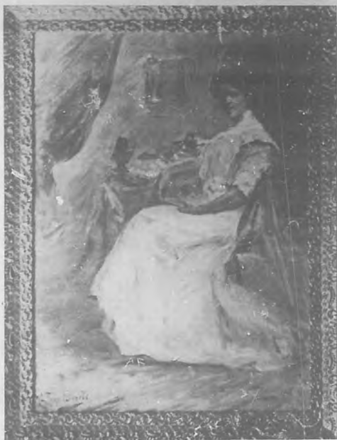
Retrato de X, por la Srta. Ginerés.

Me consta que su maestro, el Sr. Leopoldo Ro-