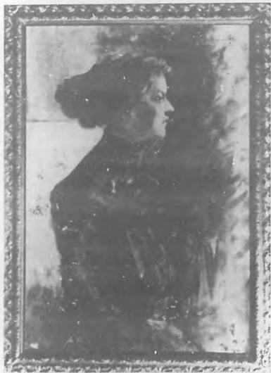
Estudio por la Srta. Ginerés.

ENTRE los cuadros que se exhiben en la Exposición de la Academia de San Alejandro, uno, especialmente, atrae las miradas del público. Su asunto, sin embargo, no puede ser más sencillo: una joven, sentada, cosiendo su sombrero. ¿Qué hay en esa pintura para llamar la atención? Lo que en los retratos de Greuze: un encanto, una seducción indefinibles, que no se sabe de dónde provienen. Las tintas argentadas del fondo, parecen un eco de las tintas de la figura principal. No hay contrastes violentos. Una luz tenue é indecisa lo envuelve todo. Díjase que la joven es presa de una dulce preocupación, que, fluyendo de