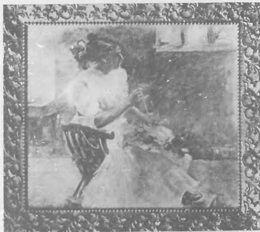
"Confeccionando el sombrero"—Cuadro por la Srta. Ginerés.

No ha hecho todavía María Teresa estudios de composición, de suerte que ninguno de sus cuadros puede analizarse desde el punto de vista del asunto. No lo tienen. Hasta ahora sólo hay que ver en las obras de esta alumna, lo único que en ellas hay: la línea y el color. Ambas cosas ha logrado dominarlas. A su lápiz