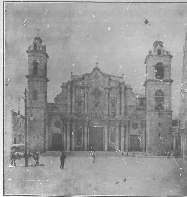
CATEDRAL DE LA HABANA